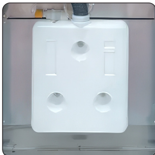
DEPÓSITO DETERGENTE 20 L (DE SÉRIE)