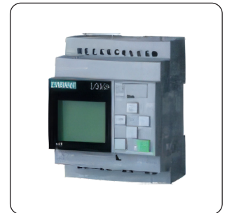
PLC (DE SÉRIE)