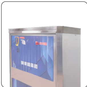
TAMPO EM INOX (EM OPÇÃO)