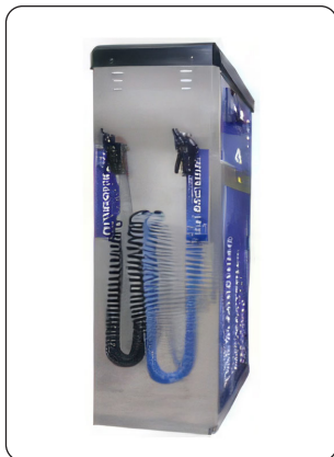
SUPORTE LATERAL PARA PISTOLAS DOS KITS ADICIONAIS