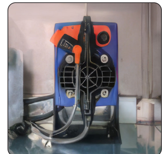
BOMBA DOSEADORA DE DETERGENTE (DE SÉRIE)