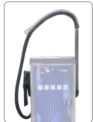
BRAÇO COM MOLLA PARA SUPORTE DO TUBO (OPCIONAL)