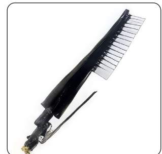
ESCOVA DE DISTRIBUIÇÃO DE ESPUMA (DE SÉRIE)