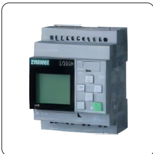
PLC (DE SÉRIE)