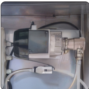
BOMBA EM INOX (EM OPÇÃO)