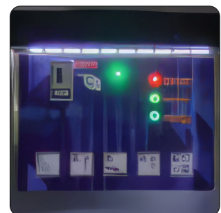
KIT DE ILUMINAÇÃO LED (OPCIONAL)