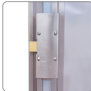
FECHADURA COM 3 PONTOS DE FECHO (DE SÉRIE)