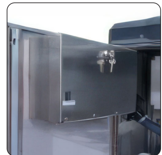
MOEDEIRO COM FECHADURA (DE SÉRIE)