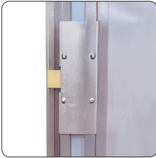
FECHADURA COM 3 PONTOS DE FECHO (DE SÉRIE)