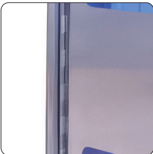
DOBRADIÇA COMPLETA EM INOX NA PORTA (DE SÉRIE)