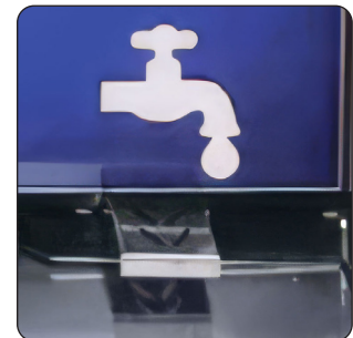
PEDAL DE ÁGUA COM INTERRUPTOR ELÉTRICO (PADRÃO)