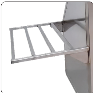
SUPORE LATERAL PARA TAPETE (OPCIONAL)