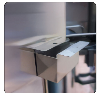
MOEDEIRO COM FECHADURA (DE SÉRIE)