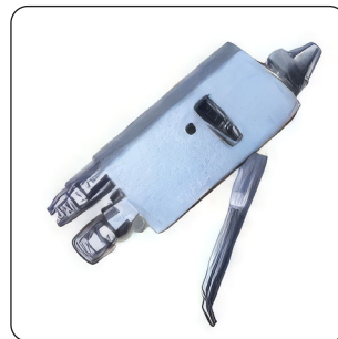
PISTOLA DE PULVERIZAÇÃO ANTIBACTERIANA (DE SÉRIE)