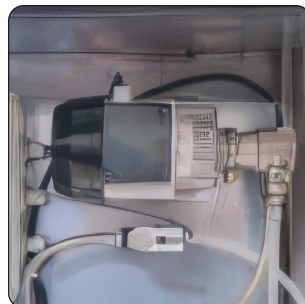
BOMBA INOX PARA JANTES (OPCIONAL)