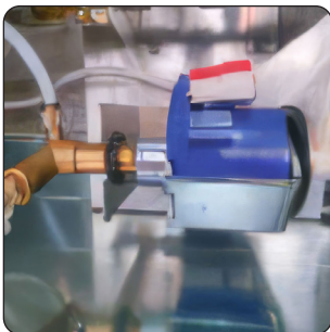
BOMBA ELETROMAGNÉTICA (DE SÉRIE)