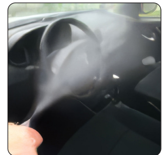
BACTERICIDA SOB PRESSÃO