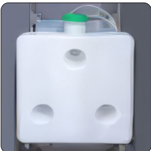
DEPÓSITO DE COMBUSTÍVEL DE 10/20 LITROS (DE SÉRIE)